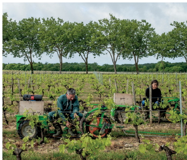
Château La Fleur des Aubiers (33)

Présents sur l'ensemble du territoire, les médecins du travail, les infirmiers en santé au travail et les conseillers en prévention des risques professionnels sont à l'écoute de vos problématiques de santé et de sécurité au travail, que vous soyez salarié agricole ou exploitant, employeur de main d'œuvre ou pas. Ces professionnels peuvent vous apporter des solutions adaptées et personnalisées dans le cadre de la santé sécurité au travail.